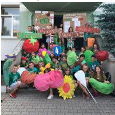
Klasa V d i VI c